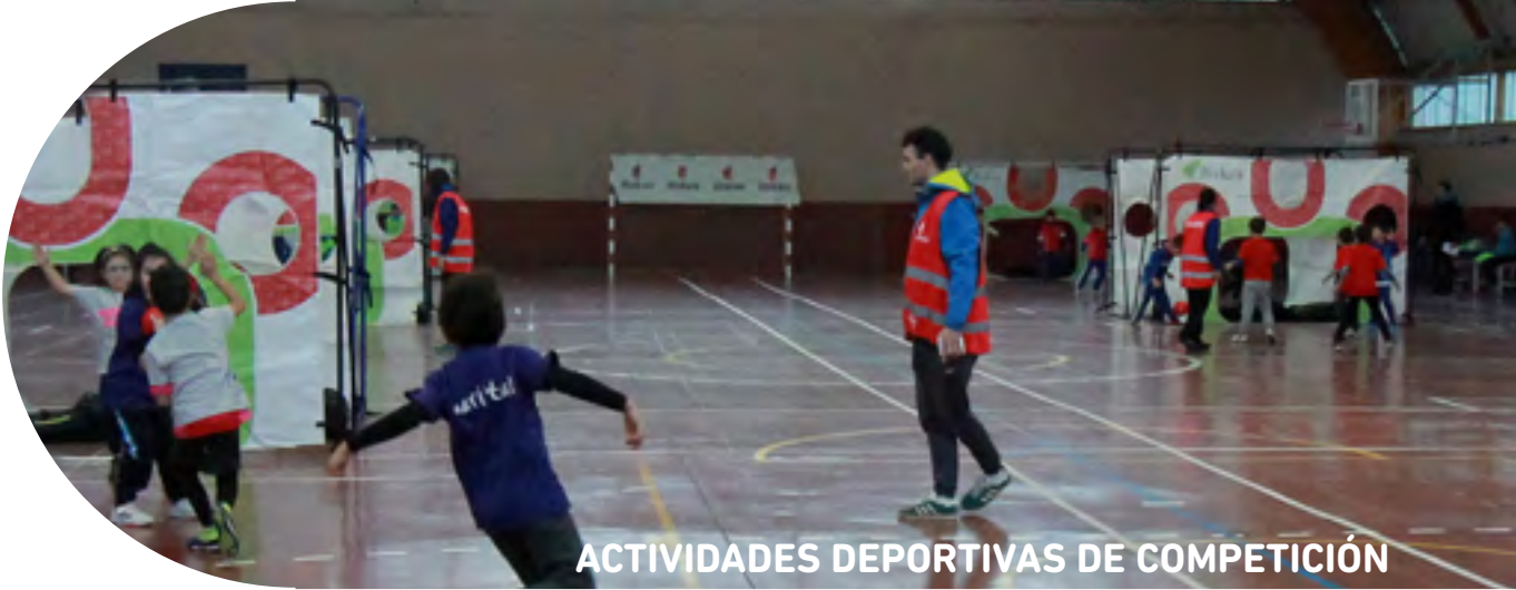
ACTIVIDADES DEPORTIVAS DE COMPETICIÓN

b) Sanciones. Según el tipo de infracción cometida, las sanciones podrán ser: